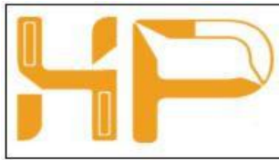
Gambar 2.1 Logo Hoppas Creative