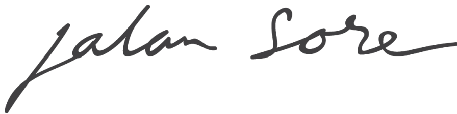
Gambar 2.1. Logo Perusahaan Jalan Sore

Rumah produksi Jalan Sore merupakan rumah produksi yang dibentuk pada tahun 2016, namun secara resmi berdiri pada tanggal 27 April 2018 di bawah PT Ruang Antar Bintang. Rumah produksi terletak di Kebayoran Baru, Jakarta Selatan.