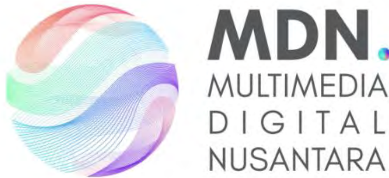
Gambar 2.1 Logo PT Multimedia Digital Nusantara