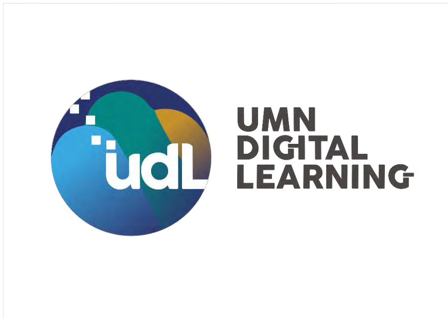
Gambar 2.3 Logo UMN Digital Learning