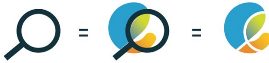
Gambar 2.2 Filosofi Logo Edigy

Edukita memiliki fokus dan tujuan untuk mengembangkan dan pemeratakan pendidikan di Indonesia, pada logo dapat dilihat dengan adanya komponen kaca pembesar.