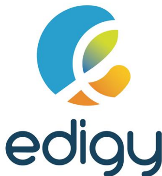
Gambar 2.1 Logo Edigy

Logo Edigy mewakili identitas Edigy sebagai tempat pembelajaran yang berbasis daring yang modern dan gampang dijangkau. Komponen-komponen dari logo Edigy dapat dielaborasi sebagai berikut. Komponen pembentuk huruf E menggambarkan insial Edukita.