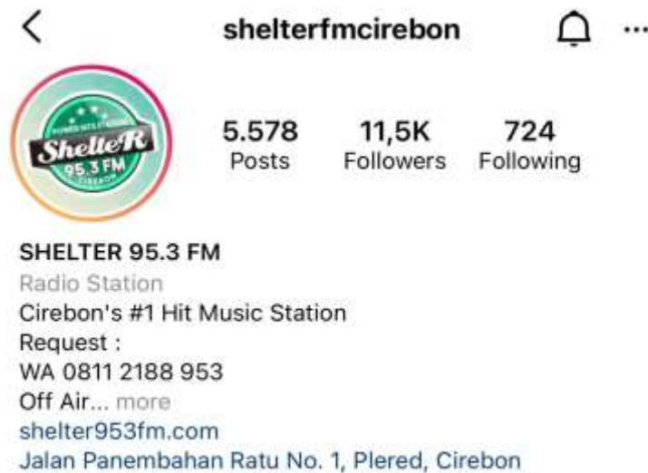
Gambar 1. 2 Profil Akun Instagram @shelterfmcirebon