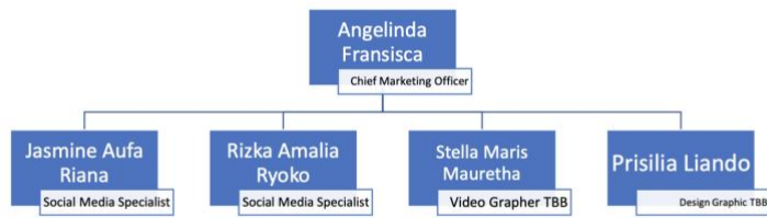
Gambar 2.5. Struktur Organisasi The Bath Box

Berikut ini adalah struktur organisasi kantor pusat dan tata kerja di Bloomka.