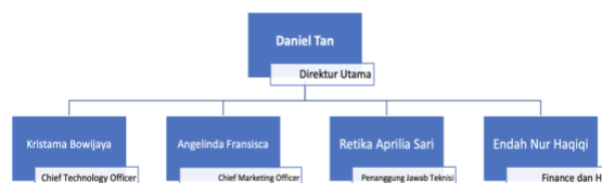
Gambar 2.4. Struktur Organisasi PT. Mitra Kreasi Natural

Berikut ini adalah struktur organisasi kantor pusat dan tata kerja di PT.Mitra Kreasi Natural.