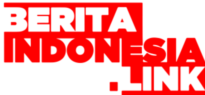
LOGO BERITA INDONESIA LINK