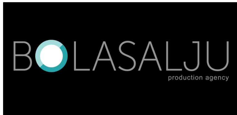
Gambar 2. 2 Logo perusahaan BolaSalju

Untuk brand image juga perusahaan memilih warna biru muda yang melambangkan warna dari BolaSalju. Tampilan logo sederhana yang dipilih juga melambangkan hal yang simple namun berkelas. Tagline yang dimiliki oleh perusahaan BolaSalju production agency adalah “ Smart Thinking, Beautiful Work ”. Kata-kata tersebut mengartikan bahwa perusahaan BolaSalju bekerja dengan pemikiran yang simple , namun diakhiri dengan konsep pekerjaan yang sangat berkesan. Beberapa ide seperti tidak terpikirkan oleh siapapun, lahir secara original dari perusahaan BolaSalju.