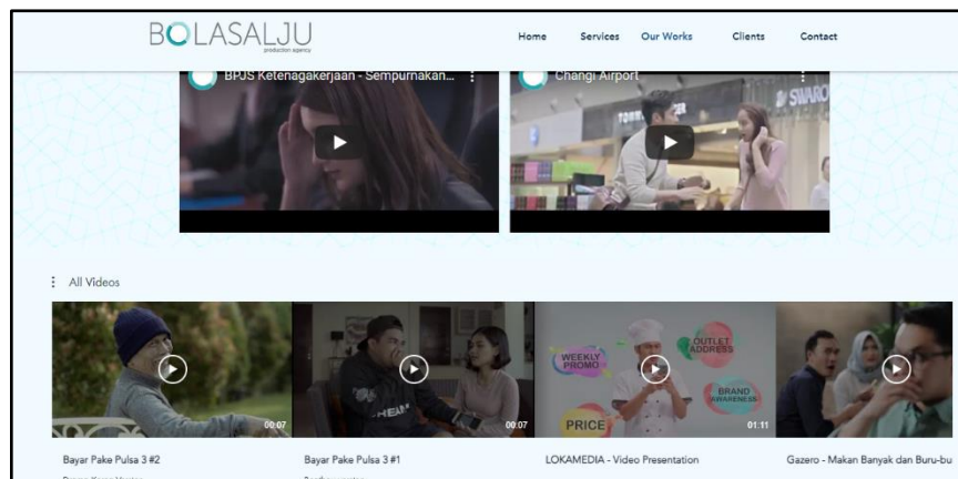
Gambar 2. 1 Portofolio perusahaan BolaSalju

terhadap bidang industri yang berubah ke arah digital . Contohnya seperti pekerjaan design dan juga media sosial yang banyak membutuhkan agency untuk mengurus project-project client . Maka perusahaan BolaSalju juga menerima permintaan client yang berhubungan dengan digital .