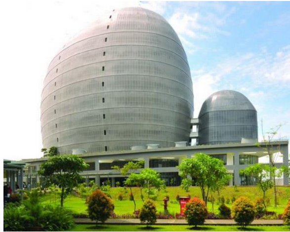
Gambar 2.1 New Media Tower