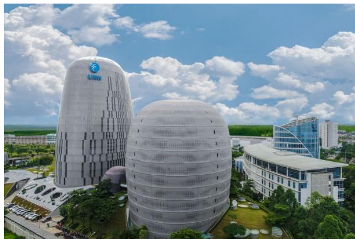
Gambar 2.2 Gedung-gedung UMN

Sejak berdiri hingga saat ini UMN terus berkembang. Hingga saat ini UMN memiliki 4 gedung dengan gedung terbarunya diresmikan tahun 2017 dan memiliki 13 program studi serta 1 program magister. Gedung terbaru UMN bernama P.K. Ojong-Jakob Oetama Tower. P.K. Ojong-Jakob Oetama Tower kembali menerapkan desain pasif seperti New Media Tower. Selain perkembangan di UMN, Yayasan Multimedia Nusantara juga telah mendirikan Politeknik Multimedia Nusantara (PMN). PMN kembali didesain oleh DCM Jakarta dan tetap menerapkan desain pasif.