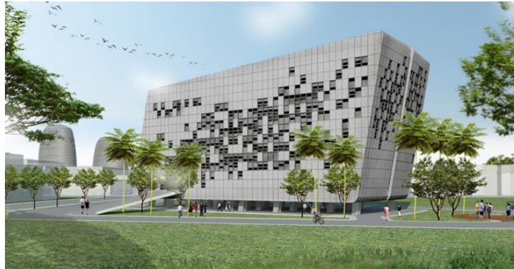
Gambar 2.3 Politeknik Multimedia Nusantara