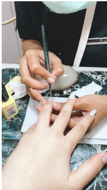
Gambar 3.2 Bukti Observasi

Observasi dilakukan pada beberapa salon kuku di Jakarta, antara lain adalah Seashell dan Amorelash yang terletak di Jakarta. Observasi bertujuan untuk melihat pengerjaan mengamati perbedaan pengerjaan perawatan kuku yang dilakukan oleh nail technician dan professional nail technician . Penulis melakukan observasi dengan cara menjadi customer pada kedua salon kuku tersebut.