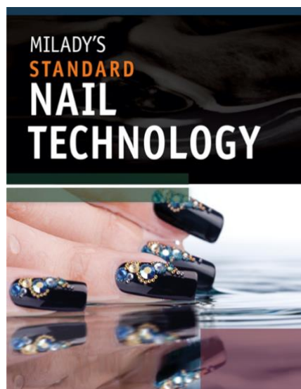
Gambar 3.4 Milady's Standard Nail Technology

Buku pertama adalah Milady's Standard Technology . Buku ini dirancang oleh Milady's Team . Buku ini membahas secara detail mengenai perawatan kuku dan pengaplikasian cat kuku. Pada setiap bab buku ini terdapat review dan juga soal yang harus dijawab ketika telah menyelesaikan masing-masing bab. Buku Milady's Standard Nail Technology terdiri dari gambar dan tulisan. Gambar digunakan untuk menjelaskan tentang teknik perawatan kuku maupun pengenalan tentang produk kuku. Dapat dilihat pada cover buku menampilkan hasil akhir kuku yang telah didesain menggunakan aksesoris kuku.