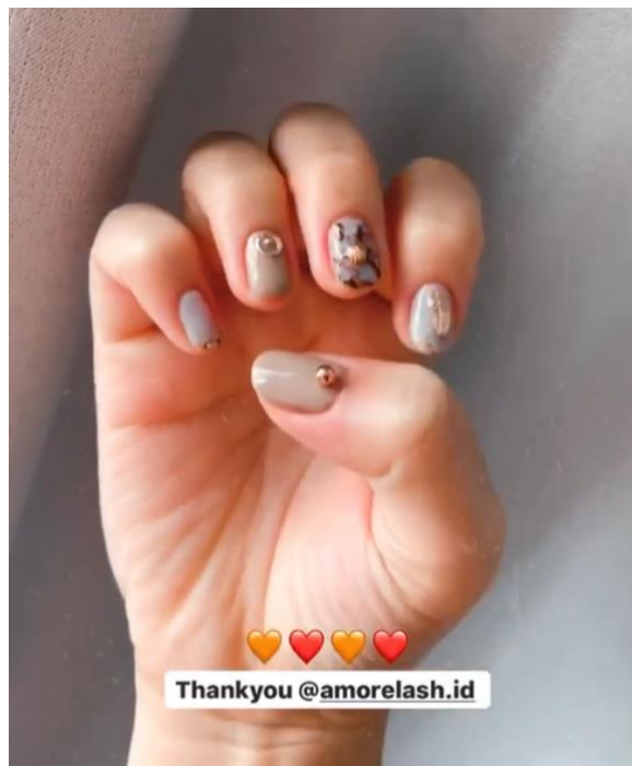
Gambar 3.3 Bukti Observasi 2

Berdasarkan hasil observasi pada Seashell Nail & Lashes Salon, penulis mendapatkan data bahwa tidak semua nail technician di Seashell mendapatkan sertifikasi pembelajaran mengenai nail art dan perawatan kuku. Namun pembelajaran tersebut didapatkan dari owner salon kuku Seashell. Salah satu nail technician di Seashell merupakan lulusan dari salah satu tempat kursus nail art di Jepang. Nail technician disana mempelajari hal tersebut berdasarkan minat dan tuntutan pekerjaan.