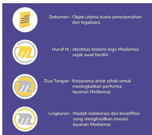
Gambar 2.1. Logo Mediamaz

Mediamaz Translation memiliki filosofi dalam logonya. Karena Mediamaz merupakan perusahaan jasa penerjemah, ide awalnya berasal dari sebuah dokumen karena penerjemah dan legalisasi membutuhkan dokumen dalam pengerjaannya. Kemudian diolah menjadi sebuah gambar yang dapat mewakili perusahaan mediamaz ini ( https://mediamaz.co.id/ )