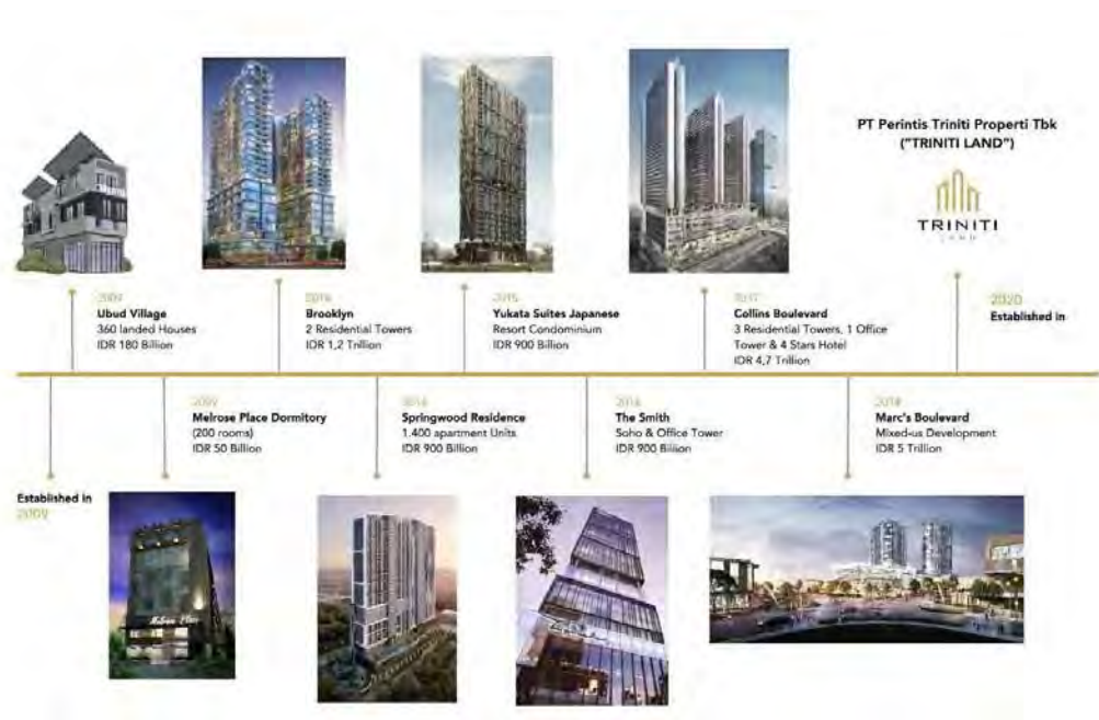
Gambar 2.2 Sejarah Perjalanan PT Perintis Trinitis Properti, Tbk

Seperti yang sudah dijelaskan di atas, di bawah ini merupakan skema perkembangan PT Perintis Trinitis Properti, Tbk yang mengawali pembangunannya dari proyek pengembangan tanah seluas 5 hektar dan sampai akhirnya melangkah kaki sebagai perusahaan publik pada awal tahun 2020 lalu. Kini, PT Perintis Trinitis terus melebarkan sayap melalui proyek - proyek inovasinya.