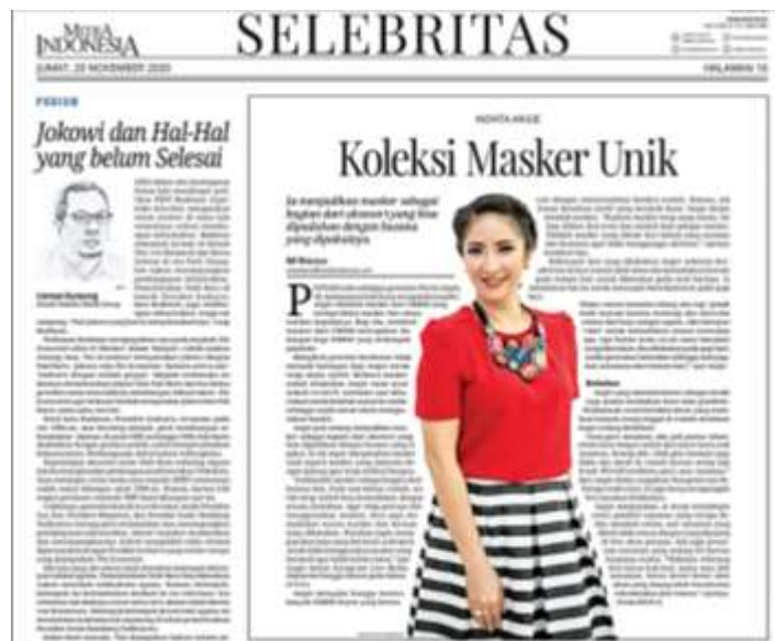
Gambar 3.2 Berita Selebritas yang Dimuat untuk Edisi Koran

Tak hanya untuk penulisan kanal weekend , penulis pun juga mendapat penugasan menulis berita ‘Selebritas’ untuk edisi koran. Hal ini jauh lebih sulit bagi penulis dikarenakan berita harus panjang karena untuk stok berita ‘selebritas besar’. Awalnya sangat sulit, namun ketika sudah melihat hasilnya dan dimuat dalam koran, penulis cukup bangga karena bisa menulis edisi koran meskipun masih butuh banyak bimbingan.