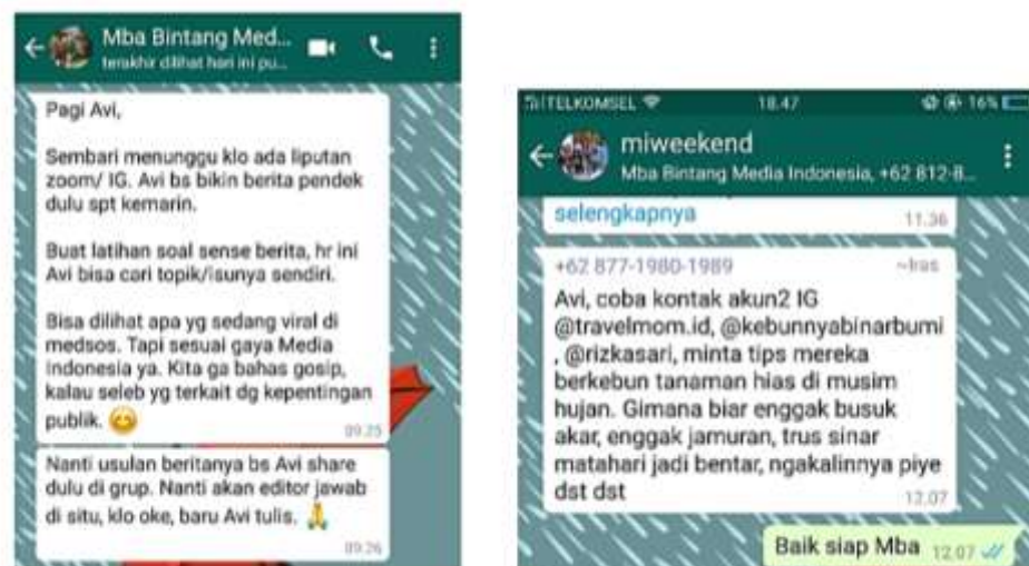
Gambar 3.1 Contoh Penugasan yang Diberikan

Selama 60 hari kerja dalam kurun waktu 13 minggu, selain menyadur berita dari media luar negeri dan media sosial penulis sudah melakukan liputan sebanyak 10 kali, melakukan wawancara tertulis sebanyak 1 kali, membuat berita seleb untuk edisi koran sebanyak 1 kali, serta membuat berita dari siaran pers sebanyak 3 kali.