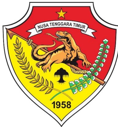
Gambar 2. 1 Logo Badan Pendapatan dan Aset Daerah Provinsi Nusa Tenggara Timur