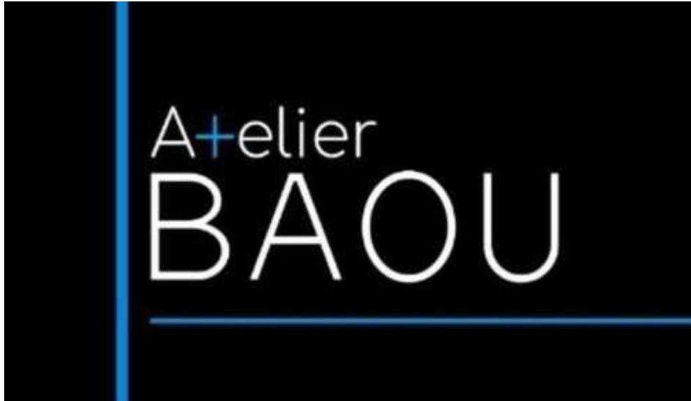
Gambar 2. 1 Logo Atelier BAOU

Atelier BAOU merupakan studio arsitektur yang berada di Piazza The Mozia blok E9 no. 19, BSD, Tangerang Selatan. Studio ini dibuat dan didirikan oleh tiga orang arsitek muda pada tahun 2017 dengan visi memberikan desain khusus dengan menerapkan inovasi, simple dan kekinian untuk memberikan kontribusi arsitektur di Indonesia (BAOU, 2017). Principal Prima Dyfari merupakan lulusan Arsitektur dari Universitas Islam Indonesia pada tahun 2014, sebelum mendirikan Atelier BAOU Prima bekerja di THG Architect & Partners (BAOU, 2017).