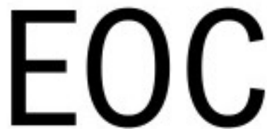
Gambar 2.1. Logo Each Other Company ( https://www.linkedin.com/company/eachothercompany/ , 2021)

Each Other Company merupakan studio desain multidisiplin berbasis di Jakarta. Each Other Company dibangun dengan fokus akan industri kreatif sebagai kontribusi untuk bisnis, budaya, dan komunitas yang lebih baik. Karya yang dihasilkan mencerminkan upaya Each Other Company untuk memberikan kontribusi tersebut melalui upaya kolaboratif dengan klien. Sejak 2015, Each Other Company telah mengerjakan proyek dengan lingkup yang variatif yaitu identitas visual, situs web, publikasi, pameran, papan nama, instalasi, dan pengembangan produk dalam skala besar dan kecil. Each Other Company bersifat terbuka terhadap perubahan dan memberikan hasil karya yang khas dengan karakteristiknya (Each Other Company, 2015).