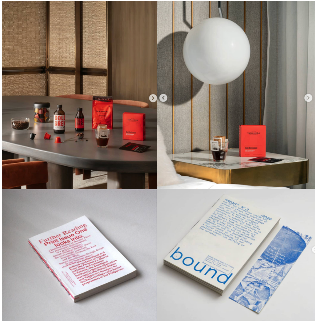
Gambar 2.2. Portfolio Each Other Company ( https://www.instagram.com/eachothercompany/ , 2021)

dan kompleks resor gaya hidup di Nusa Tenggara Timur (Each Other Company, 2015).