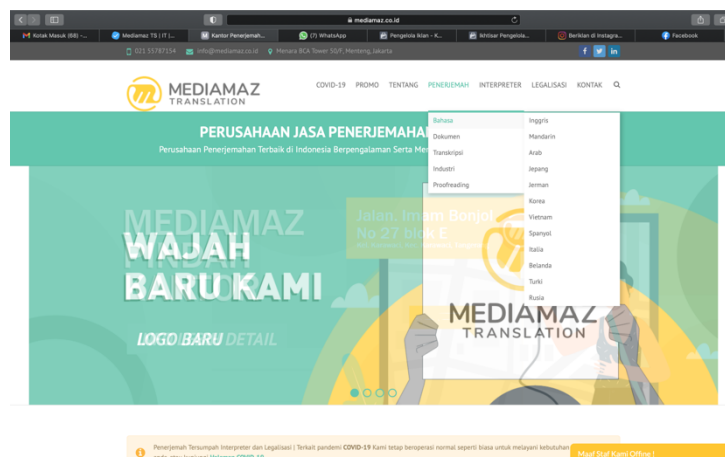
Gambar 2.3. Tampilan Website Mediamaz

Perusahaan Mediamaz Translation Service juga memanfaatkan situs-situs untuk menambah jangkauan dari client ke perusahaan jasanya dengan membuat website -nya sendiri. Berikut ini merupakan tampilan website yang dimiliki oleh perusahaan.