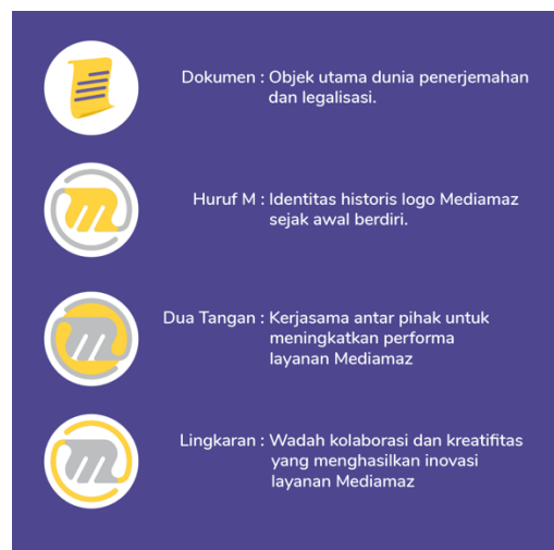
Gambar 2.2. Penejelasan Arti Logo

Logo dari Mediamaz Translation Service sendiri memiliki maknanya sendiri. Dari setiap bentuk dan ruang dari logo tersebut memiliki arti. Berawal dari bentuk dokumen menjadi sebuah logo. Berikut merupakan penjelasan dari logonya secara detail.