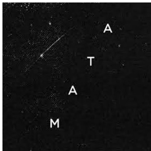
Gambar 2.1. Logo MATA Studio (Sumber: website MATA Studio )