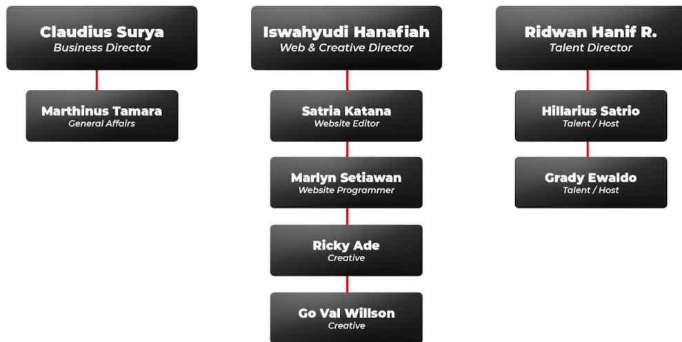
Bagan 2.1 - Susunan Redaksi AutonetMagz.com