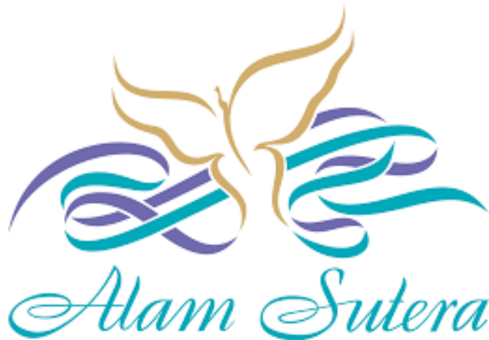
Gambar 2.1 Logo Alam Sutera

PT Alam Sutera Realty Tbk merupakan perusahaan properti yang didirikan oleh Harjanto Tirtohadiguno dan keluarganya sejak 3 November 1993 dengan nama PT Adhihutama Manunggal yang kemudian berubah nama menjadi PT Alam Sutera Realty Tbk pada 19 September 2007. Perusahaan PT Alam Sutera Realty Tbk menjadi perusahaan publik dengan melakukan penawaran umum di Bursa Efek Indonesia pada 18 Desember 2007 dengan kode perusahaan ASRI.