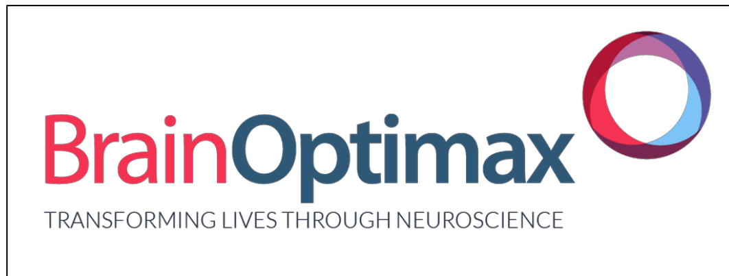
Gambar 2.1 Logo PT. Bangunindo Teknusa Jaya

Brain Optimax (representasi dari PT. Neuro Optimax Sejahtera) merupakan pusat training dan layanan psikologis yang berfokus pada proses pengoptimalan otak untuk segala usia. Brain Optimax didirikan, diawasi dan dibimbing oleh ahli kesehatan terlatih di Amerika Utara termasuk Psikolog dan Ahli Saraf berlisensi. Beberapa layanan dan jasa yang disediakan oleh Brain Optimax adalah brain assessments, psychometric tests, physiological assessments , tes atensi, HTMA, neurofeedback, physiological biofeedback , HEG, TDCS, AVE, dan CES. (Sumber: brainoptimax.com, 2020)