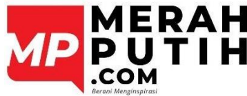
Gambar 2.1 Logo PT Merah Putih Media