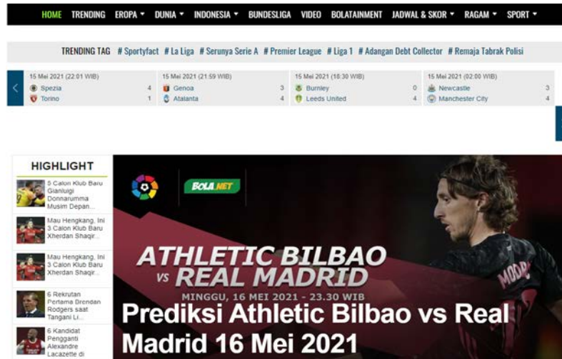
Gambar 2.2 Tampilan Kanal Bola.net