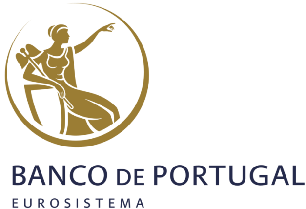
Gambar 2.1 Logo perusahaan

Pada gambar 2.1 logo Banco De Portugal, perusahaan yang berjalan pada bidang perbankan, selain bergerak pada bidang perbankan Banco De Portugal juga memiliki departemen ekonomi dan penelitian untuk mengumpulkan dan memproduksi kumpulan data mikro. Banco De Portugal memiliki posisi yang tepat untuk menjembatani kesenjangan antara produsen data mikro administratif dan komunitas peneliti pada umumnya. Itu karena mereka mengumpulkan dan menghasilkan kumpulan data mikro, atau memiliki akses istimewa ke kumpulan data administratif, sementara pada saat yang sama memiliki badan peneliti internal yang secara rutin menggunakan data tersebut untuk kegiatan penelitian mereka. Dengan demikian, bank sentral memiliki kemampuan untuk memahami data yang menjadi perhatian baik dari perspektif produsen maupun peneliti.