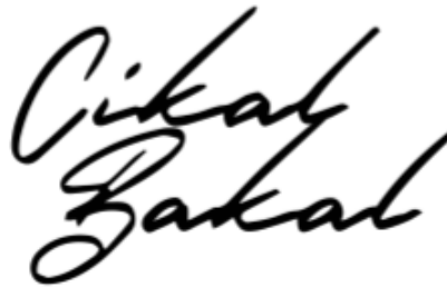
Gambar 2.3 Logo Cikal Bakal