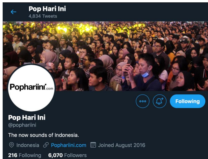
Gambar 2. 3 Media Sosial Twitter Pop Hari Ini