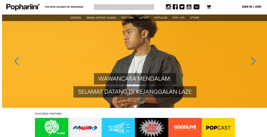
Gambar 2. 1 Situs Pop Hari Ini