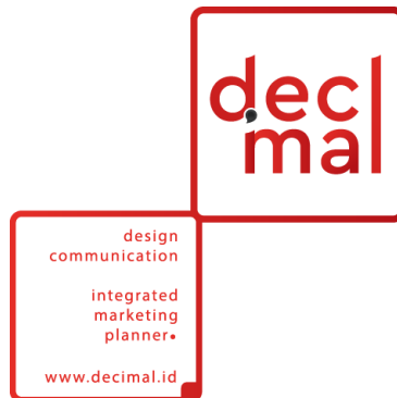
Gambar 2.1 Logo DECIMAL

Sebagai perusahaan berkembang di tengah persaingan pasar, DECIMAL terdiri dari tim yang berdedikasi tinggi dan berpengalaman di bidangnya. Mereka selalu berusaha sebaik mungkin untuk menyampaikan pesan ke pasar yang tepat. Selain itu, juga selalu berusaha untuk memberikan solusi dan strategi yang paling efektif dan efisien mengikuti kebutuhan dan tujuan yang diharapkan.