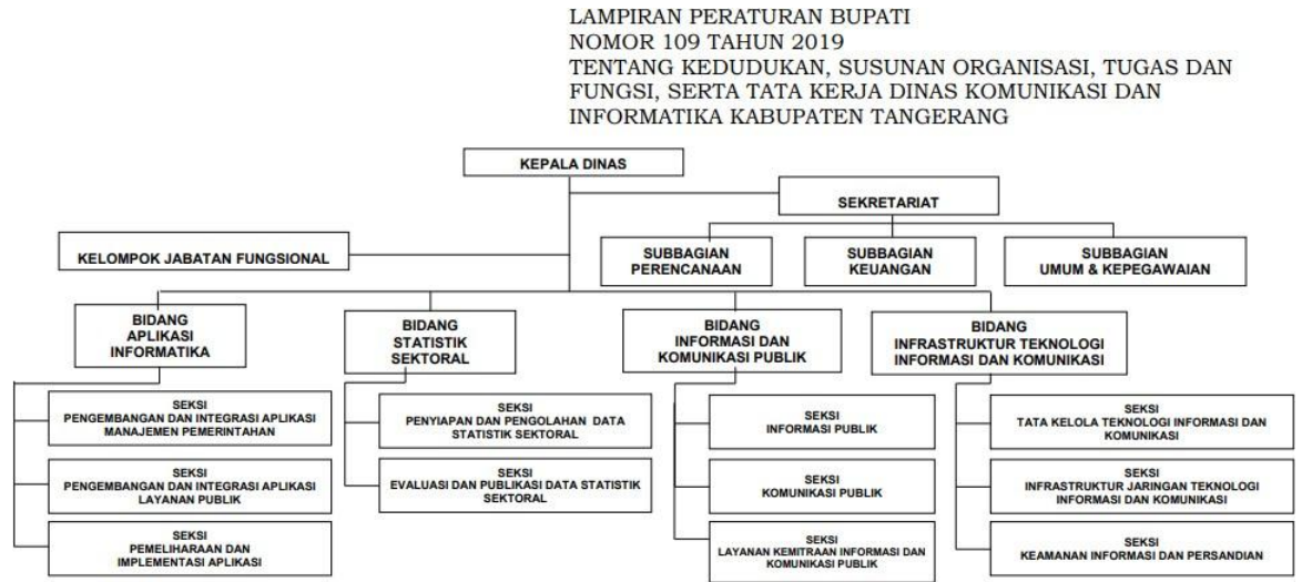
Gambar 2.2 Struktur Organisasi Diskominfo Kabupaten Tangerang