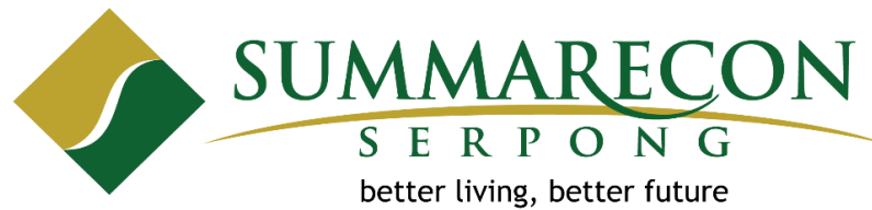
Gambar 2.2. Logo Summarecon Serpong