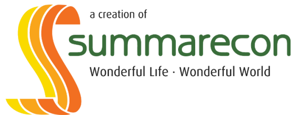
Gambar 2.1. Logo Summarecon