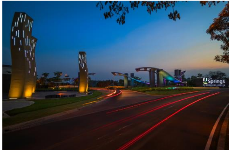
Gambar 2.5. The Springs

rumah dengan desain arsitektur yang hijau dan nyaman, kawasan ini juga terdapat sports club terbesar dan terlengkap di Jabodetabek yang bernama The Springs Club.