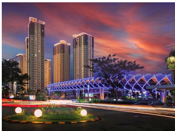
Gambar 2.6. Serpong M-Town

Summarecon Serpong juga memiliki proyek yang masih dalam tahap pengembangan yaitu Serpong M-Town. Serpong M-Town merupakan hunian yang dibagi menjadi M-Town Residence (6 tower, 3.300 unit) dan M-Town Signature (4 tower, 1.100 unit) serta M-Town Office (2 tower). Area hunian dengan konsep green resort ini terhubung dengan Summarecon Mall Serpong yang dapat diakses dengan sky bridge .