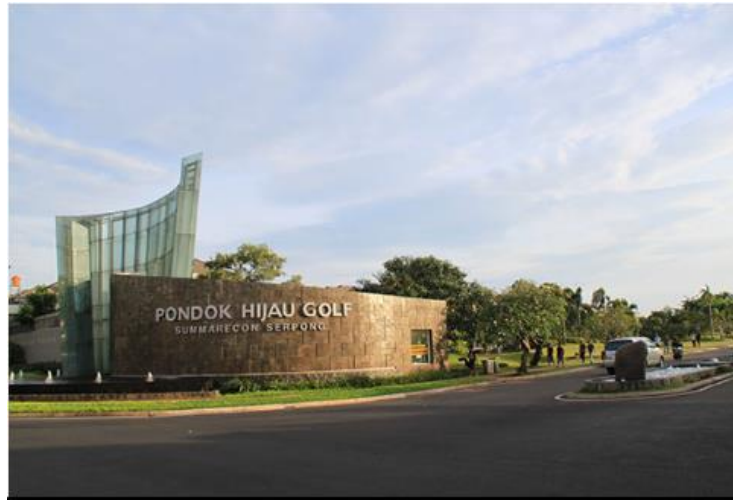
Gambar 2.3. Kawasan Pondok Hijau Golf