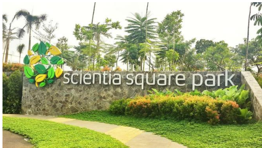
Gambar 2.4. Scientia Square Park

Adapun kawasan Scientia Garden yang dapat disebut sebagai kawasan Smart dikarenakan adanya fasilitas pendidikan dan penunjang disekitarnya, seperti Universitas Multimedia Nusantara, Universitas Pradita, Apartment Scientia Residences, dan Scientia Square Park. Kawasan ini merupakan kawasan hunian modern yang bernuansa alam dan berorientasi pada lingkungan. Saat ini, kawasan Scientia Garden memiliki banyak 2.100 rumah dan ruko serta 1.125 unit apartemen yang akan terus bertambah setiap tahunnya secara bertahap.