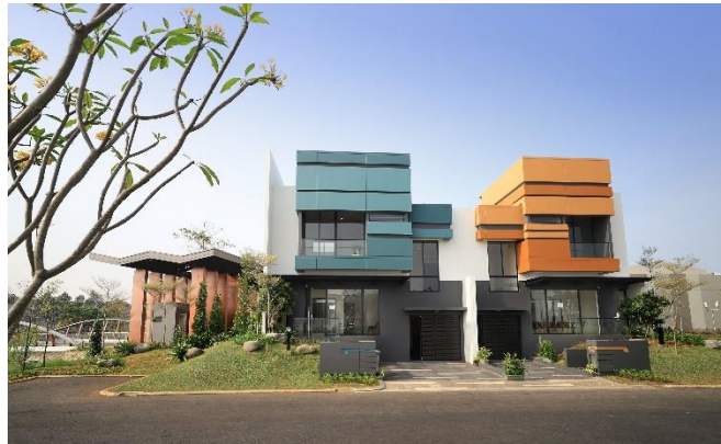
Gambar 2.7. Cluster Mozart II

Kawasan Symphonia merupakan kawasan baru yang dikembangkan pada bulan Oktober 2017. Seluas 200 hektar, kawasan yang terdiri dari beberapa cluster hunian, yaitu cluster Verdi, Rossini, Vivaldi, Mozart I dan Mozart II, memiliki konsep hunian yang memadukan gaya urban dan modern dengan keindahan alam.