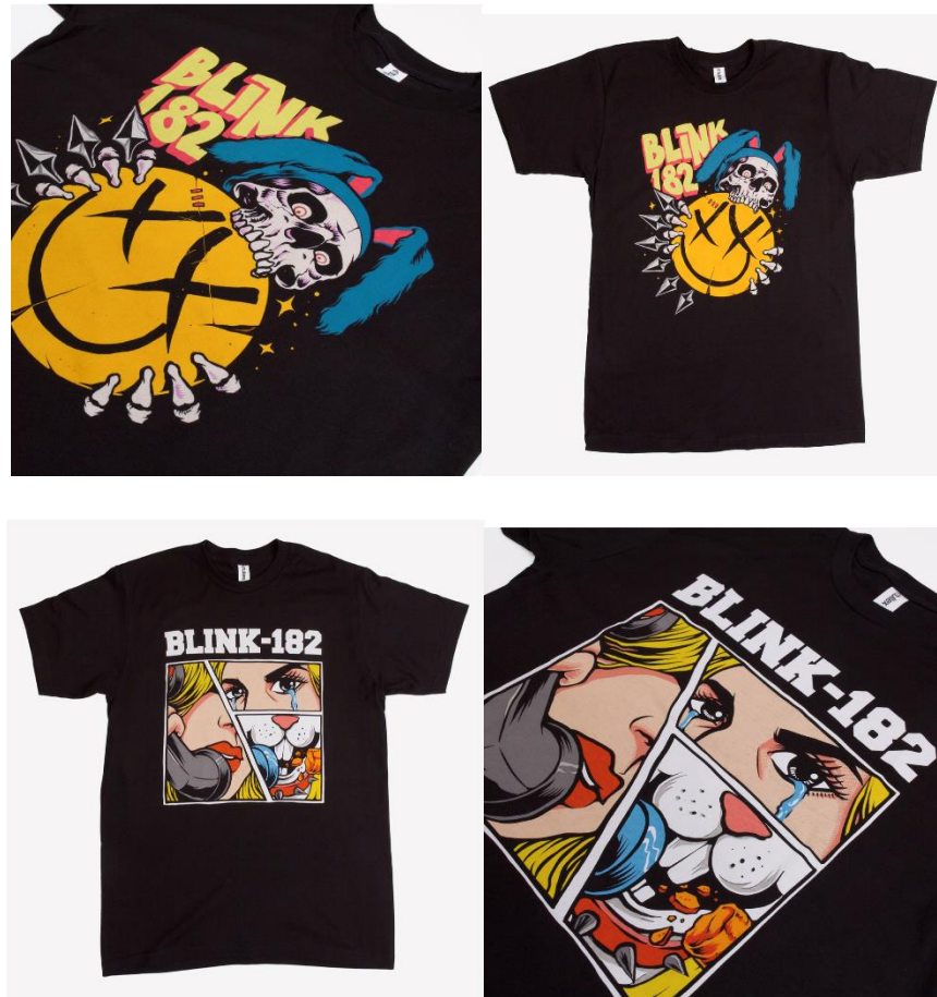
Gambar 2.4 Karya Blink-182

( https://blink182merch.com/products/the-call-tee?variant=39927178330278 )