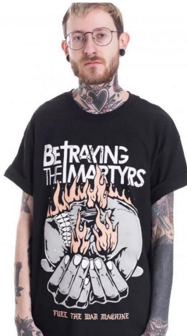
Gambar 2.3 Karya Betraying The Martyrs

Karya yang dihasilkan dari LZHR Artwork berupa desain ilustrasi yang mayoritas diperuntukan dalam Clothing Brand dan merchandise . Beberapa dari hasil kerja samanya berupa kolaborasi dengan grup band yang cukup besar.