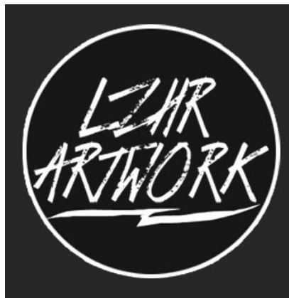
Gambar 2.1 Logo LZHR Artwork

LZHR Artwork merupakan rumah kreatif yang berfokus pada ilustrasi berbasis di Bandung. LZHR Artwork dibangun sejak 2015 untuk menawarkan suatu pihak yang membutuhkan jasa ilustrasi. Mayoritas karya yang dihasilkan biasanya untuk clothing brand tetapi selain itu juga digunakan untuk merchandise suatu komunitas atau poster. Dibalik hal yang disebutkan penulis masih banyak hasil karya yang digunakan sesuai dengan keinginan klien. LZHR Artwork memiliki ciri khas dari karyanya tersendiri oleh karena itu mayoritas proyek dari LZHR Artwork itu mengerjakan clothing brand yang tertuju untuk komunitas pecinta musik metal .