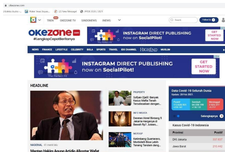
Gambar 2.1 Halaman Awal Okezone.com

Mulai Juni 2019, Okezone.com menduduki peringkat ke-2 untuk Kategori portal berita terpopuler di Indonesia (Sumber: Alexa.com). Prestasi ini tercipta karena semakin banyak pengunjung situs yang mengakses Okezone.com setiap harinya.