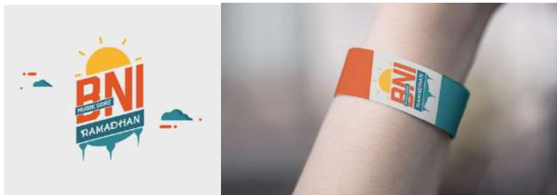
Gambar 2.3. Portfolio Perusahaan 1

Just Design Indonesia memiliki cukup banyak project design . Berikut adalah beberapa portfolio yang telah dibuat oleh Just Design Indonesia.