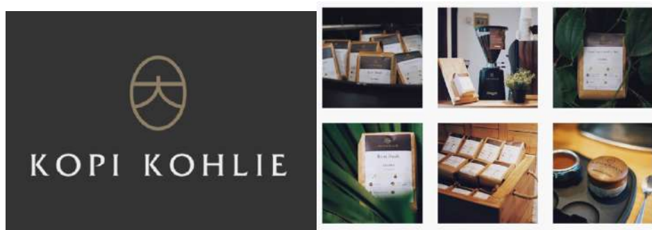
Gambar 2.5. Portfolio Perusahaan 3

Berikut adalah project Suntory Garuda Beverage – Safety Campaign Series tahun 2019 Indonesia.