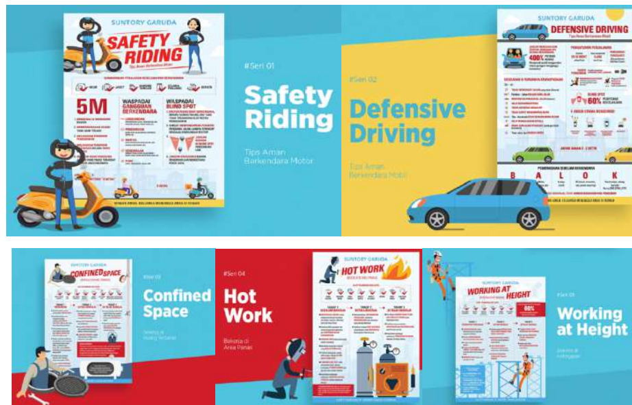
Gambar 2.4. Portfolio Perusahaan 2

Berikut adalah project Suntory Garuda Beverage – Safety Campaign Series tahun 2019 Indonesia.