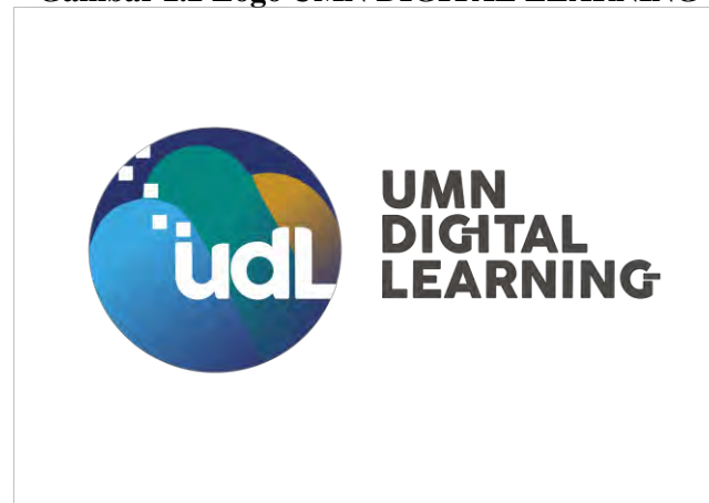
Gambar 2.2 Logo UMN DIGITAL LEARNING