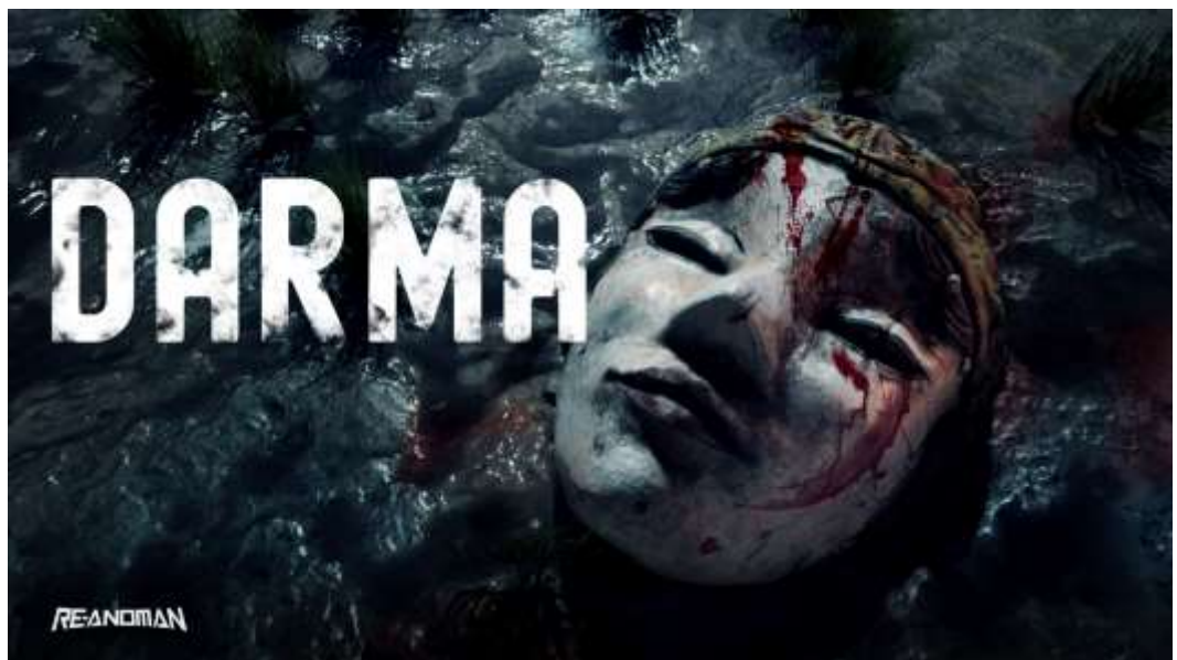
Gambar 2. 6. ProjeK Darma