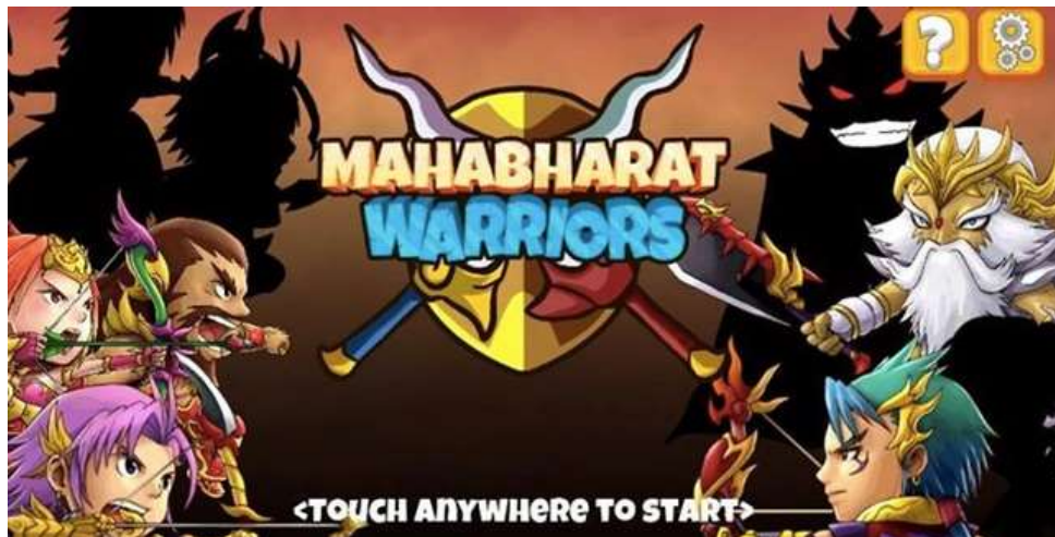
Gambar 2. 4. Mahabharat Warriors