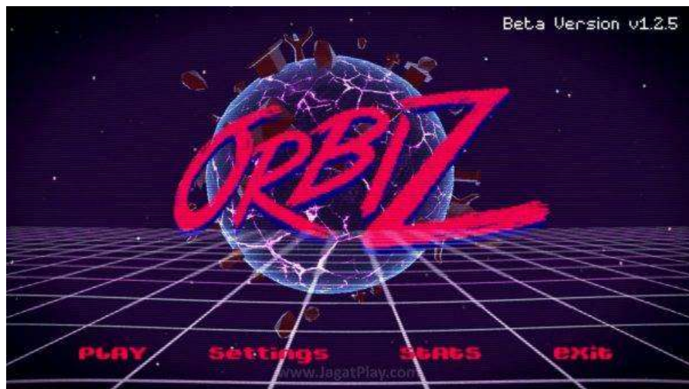
Gambar 2. 3. Orbiz