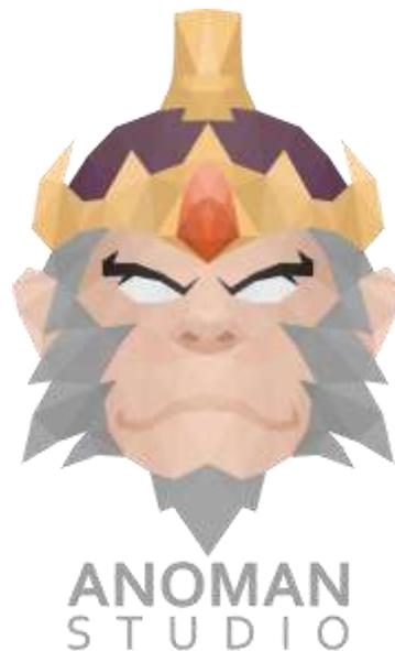
Gambar 2.1. Logo Anoman Studio