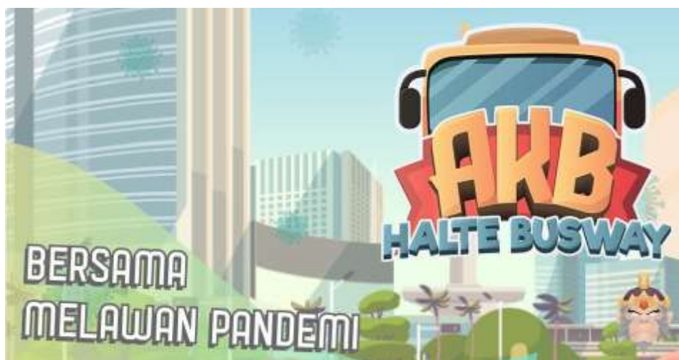
Gambar 2. 5. AKB Halte Busway