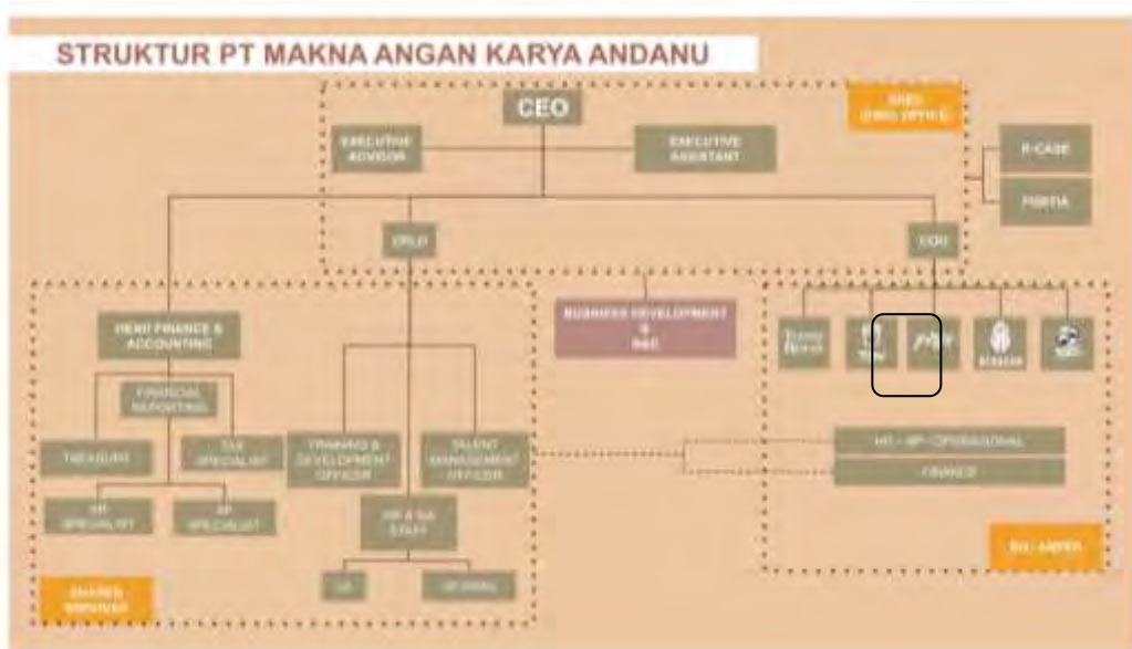
BAGAN 2. 1 Struktur Organisasi PT Makna Angan Karya Andanu