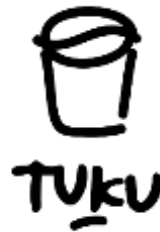
GAMBAR 2. 2 Logo Toko Kopi Tuku

Dalam sebuah visual logo, memiliki arti-arti tersendiri, yaitu garis-garis dapat diartikan sebuah repetisi yang menggambarkan sebuah bisnis yang diciptakan memiliki Makna yang baik. Kemudian Lingkaran bermakna Angan, yaitu menciptakan brand yang sustain dari segi bisnis. Yang terakhir adalah garis yang menyilang bertumpuk diartikan sebagai sebuah Karya, yang di mana inovasi-inovasi yang dibuat saling berkesinambungan satu sama lain.