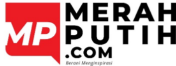
Gambar 2.1 Logo MerahPutih