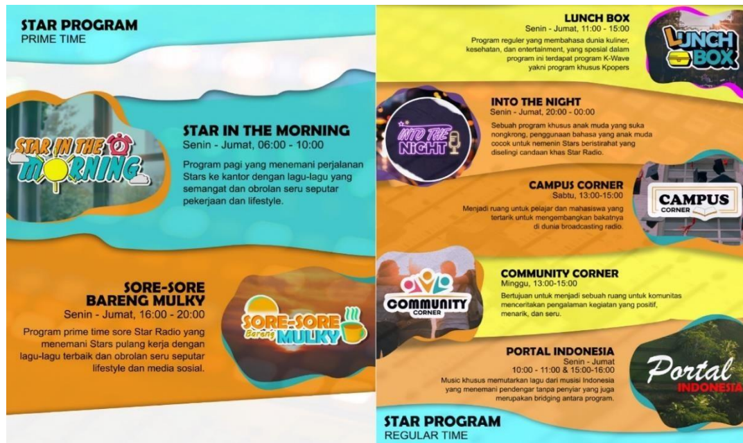
gambar 2 Program-Program On Air di Star Radio