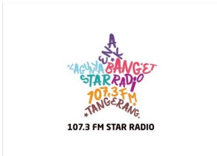
gambar 1 Logo Baru Star Radio Tangerang

Star Radio merupakan termasuk dari banyaknya media massa radio yang sudah sejak lama berdiri dan terbesar se wilayah Tangerang mempunyai frekuensi 107,3 Fm. Star Radio berdiri pada 1990 oleh Dhanny Iskandar. PT. Radio Suara Tunggal Angkasa Raya mempunyai singkatan “Star”. lokasi pertama Star Radio berada di Pasar Kemis Tangerang, berfrekuensi 106,5 Fm. Mempunyai tujuan untuk menjadikan radio yang mendapatkan hati dan memberika manfaat kepada masyarakat Tangerang, Bogor, Bekasi, Depok dan Jakarta. Mempunyai tagline “LAGUNYA ENAK BANGET” Star radio konsisten dalam memutarakan informasi terbaru berhubungan dengan teknologi, Hiburan, pola hidup lifestyle , olahraga, informasi artis atau influencer , semua informasi seputar kota Tangerang, dan barengi dengan lagu hits-hits terbaik saat ini,