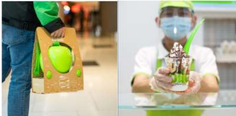
Gambar 2.4 Hasil Kanekin dengan Ilaollao