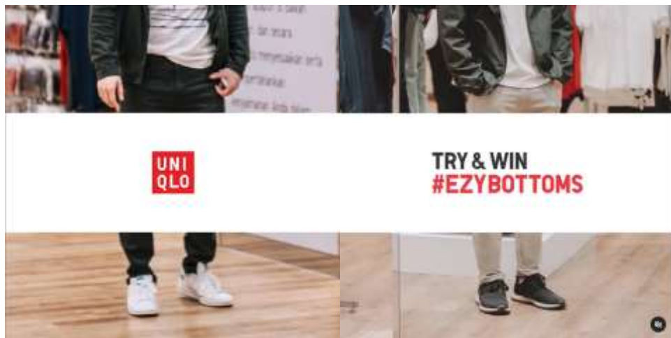
Gambar 2.2 Hasil Kanekin dengan Uniqlo

Uniqlo merupakan brand baju lifestyle yang sudah berada di Indonesia cukup lama, Kanekin pernah dipakai sebagai Creative Agency untuk mengurus perihal media social Uniqlo. Photoshoot dilakukan di dalam store Uniqlo dengan style tryout