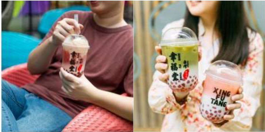
Gambar 2.5 Hasil Kanekin dan Xing Fu Tang