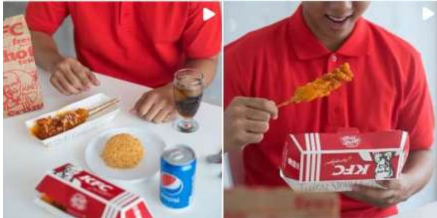
Gambar 2.3 Hasil Kanekin dengan KFC

Kentucky Fried Chicken atau sering disebut sebagai KFC pernah menggunakan Kanekin sebagai Creative Agency dalam rangka mempromosikan produk hotrod dengan pakatnya.