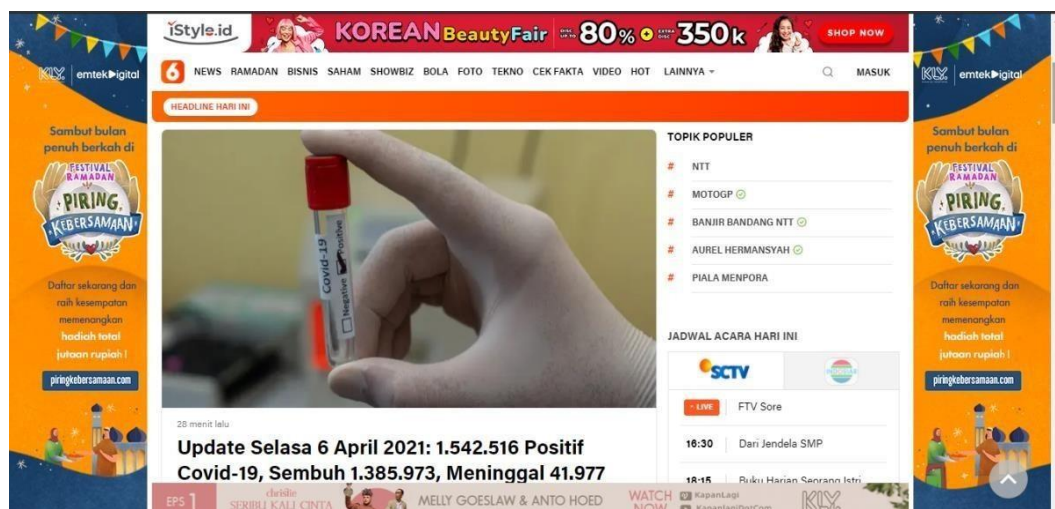
Gambar 2.4 Laman Utama Liputan6.com