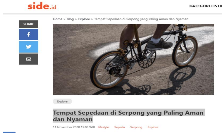
Gambar 3.2. Contoh Artikel Feature

Artikel di atas adalah contoh artikel yang dibuat oleh penulis. Dalam membuat artikel feature , penulis dituntut untuk kreatif dalam pembuatan ide penulisan. Munculnya ide penulisan pada artikel di atas berasal dari keresahan orang-orang Jakarta yang semenjak pandemi banyak orang yang mulai hobi bersepeda, lalu banyak kasus kriminal seperti pencurian sepeda secara paksa saat berkendara. Oleh karena keresahan itu, penulis berinisiatif untuk membuat artikel feature di atas.