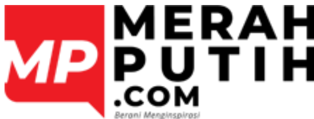
Gambar 2.1 Logo Perusahaan

Merahputih.com memiliki lima desk , di antaranya Berita, Indonesiaku, Hiburan & Gaya Hidup, Olahraga, Infografis, Foto dan Video. Misi utamanya adalah menjadi platform berita yang menginspirasi, mendidik, dan informatif bagi pembaca khususnya generasi muda Indonesia. Guna menghasilkan berita yang tepat, Merahputih.com membentuk tim untuk mengkoordinasikan kinerja karyawannya. Harapannya, Merahputih.com mampu memperluas dan mempertahankan para pembacanya dari generasi ke generasi (Merahputih, para. 1).