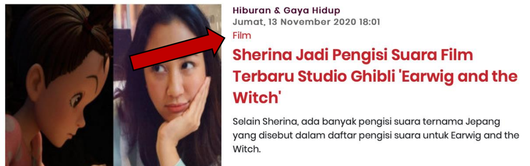
Gambar 2.5 Label Pada Artikel Merahputih.com

Pelaksanaan kerja magang di Merahputih.com terbagi menjadi enam bagian dengan menerapkan label tertentu sehingga memudahkan pembaca dalam mencari berita yang diinginkan. Label tersebut merupakan judul yang menginformasikan spesifikasi bahasan seperti Kesehatan, Teknologi, Kuliner, Kecantikan, Games, dan lain sebagainya. Label ini dibuat oleh redaktur feature beserta jajarannya. Penentuan informasi pada label tersebut dilakukan oleh Editor untuk menyesuaikan isi bahasan yang telah dibuat oleh penulis bersama jurnalis feature lainnya.