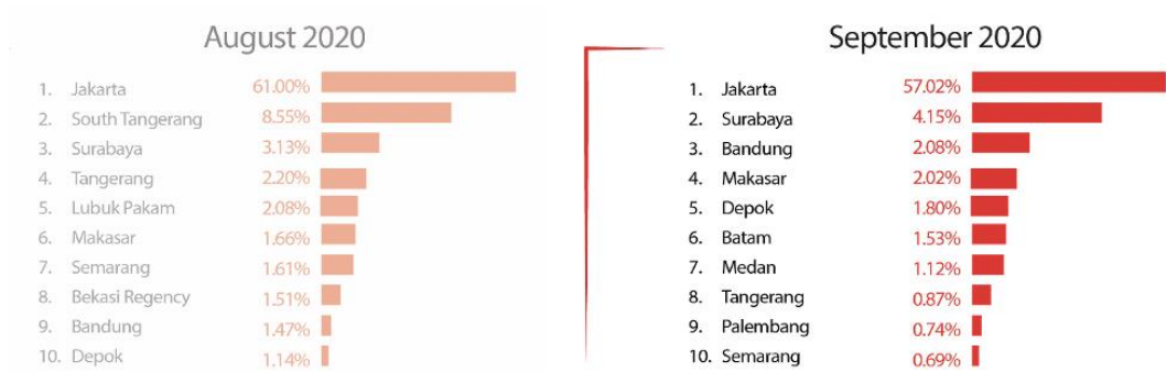
Gambar 2.3 Data Angka Pembaca per Wilayah