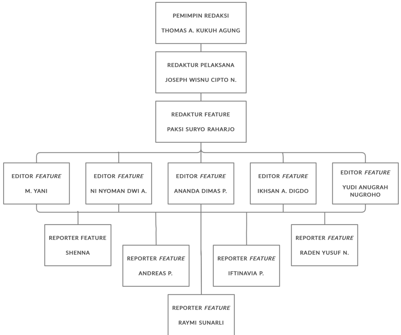
Gambar 2.6 Struktur Redaksi Desk Feature Merahputih.com