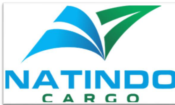
Gambar 2.1 Logo Perusahaan - Natindo Cargo

PT Khasanah Citradatindo atau Natindo Cargo (Gambar 2.1) adalah perusahaan jasa yang bergerak di bidang impor sebagai forwarder impor dari luar negeri ke Indonesia, dengan spesialisasi impor dari China ke Indonesia yang didirikan pada tahun 2012. Selain sebagai forwarder impor, Natindo Cargo juga melayani : (1) Jasa titip transfer; (2) Jasa belanja; (3) Kelas impor untuk mengedukasi masyarakat tentang impor, seperti definisi impor, jenis-jenis impor, peraturan impor, dan masih banyak lagi.