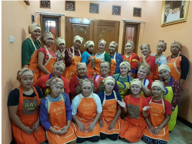
Gambar 2.3 Karyawan AWW Cake And Cookies

Pada Gambar 2.3 Karyawan Aww Cake And Cookies itu tersendiri yang berjumlah 23 orang. Dimana dimasing masing orang memiliki bagiannya yakni Produksi, Pemasaran, Finishing, Penjualan.