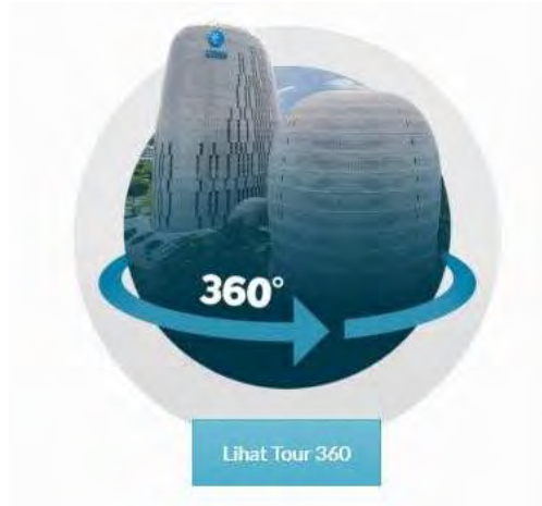
Gambar 2.15. Virtual Tour UMN