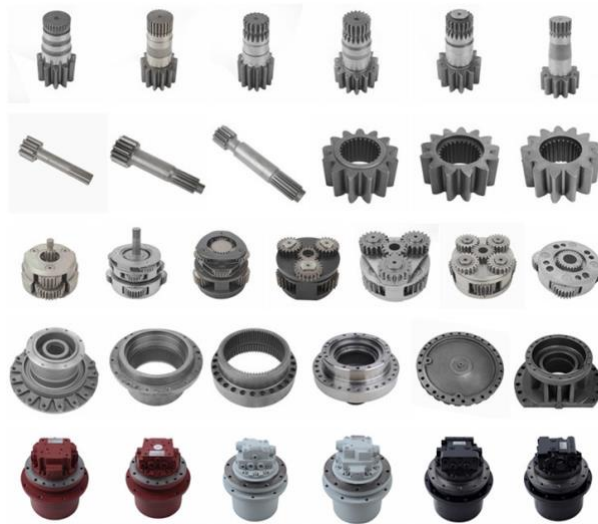
Gambar 2.9 Produk Spare Parts yang di Supply PT. MDS