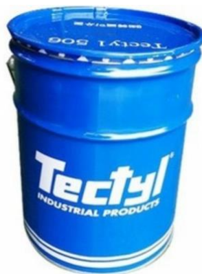
Gambar 2.6 Produk Tectyl yang di Supply PT. MDS