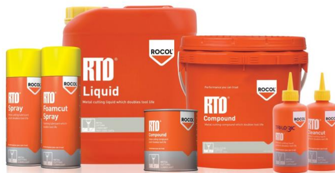
Gambar 2.7 Produk Rocol yang di Supply PT. MDS