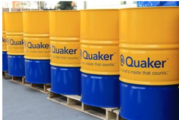
Gambar 2.4 Produk Quaker yang di Supply PT. MDS