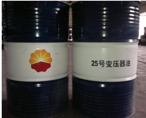
Gambar 2.5 Produk Kunlun yang di Supply PT. MDS