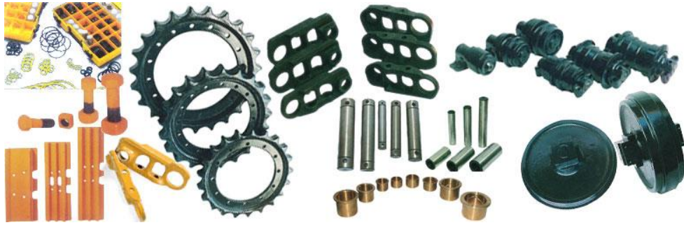
Gambar 2.8 Mitsubishi Genuine Parts yang di Supply PT. MDS