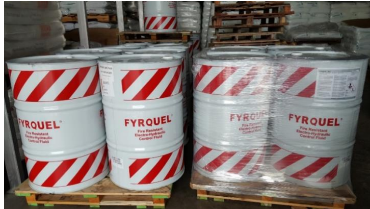
Gambar 2.3 Produk Fryquel yang di Supply PT. MDS

Fryquel EHC Plus merupakan cairan kontrol elektro hidrolis ester pemadaman otomatis generasi ketiga yang dirancang untuk aplikasi turbin uap yang secara langsung menggantikan cairan ester fosfat generasi sebelumnya.