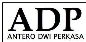
Gambar 2.1 Logo Perusahaan

PT. Antero Dwi Perkasa memiliki hubungan perusahaan dengan UD. Maju Bersama yang juga dibidang produk plastik, walaupun mereka memiliki gudang yang sama tetapi dalam penanganan stok dan sistemnya masing-masing. Logo perusahaan dapat dilihat pada Gambar 2.1.