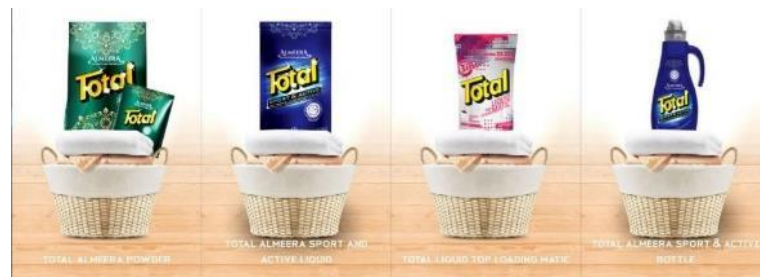
Gambar 2. 3 Laman Produk Webstie PT Total Chemindo Loka

Laman produk pada website tersebut, memperlihatkan berbagai macam produk yang dijual oleh perusahaan. Mulai dari deterjen hingga sabun cuci tangan semua produk yang mereka jual terdapat pada halaman tersebut.