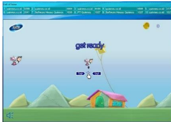
Gambar 2. 6 Laman Permainan Website PT Total Chemindo Loka