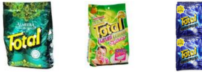
Gambar 2. 13 Beberapa Contoh Produk Perusahaan