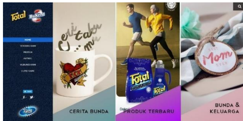
Gambar 2. 2 Laman Utama Website PT Total Chemindo Loka

BuKrim sendiri merupakan sebuah brand yang memproduksi deterjen. Brand tersebut pertama kali hadir di Indonesia pada tahun 2004, dan produk pertama yang mereka rilis adalah deterjen krim BuKrim regular yang kemudian produk tersebut dikembangkan menjadi deterjen bubuk. BuKrim juga memiliki cita-cita untuk memperluas pasar, dan salah satu cara yang mereka tempuh adalah dengan bekerja sama dengan Total. PT Total Chemindo Loka memiliki berbagai macam produk hygiene untuk ditawarkan ke konsumen, seperti deterjen, sabun cuci tangan, atau bahkan sabun cuci piring.