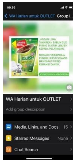
Gambar 2. 9 Grup Whatsapp Tim Sales Perusahaan