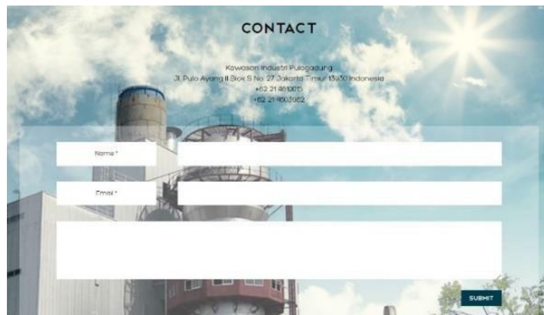
Gambar 2. 5 Laman Hubungi Kami Dalam Website PT Total Chemindo Loka

Dalam laman hubungi kami, terdapat alamat kawasan industri PT Total Chemindo Loka, yang terletak di Jl. Pulo Ayang II Blok S No. 27 Jakarta Timur 13930 Indonesia. Pada halaman tersebut juga terdapat kontak nomor telepon perusahaan, sertakolom bagi pengunjung untuk mengajukan kritik atau saran.