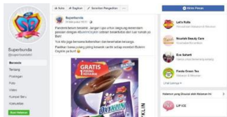
Gambar 2. 7 Laman Facebook PT Total Chemindo Loka