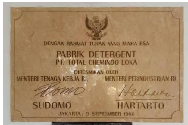
Gambar 2. 12 Foto Batu Peresmian PT Total Chemindo Loka

Perusahaan juga memiliki kawasan industri yang berlokasi di Pulogadung, Jl. Pulo Ayang II Blok S No. 27 Jakarta Timur.