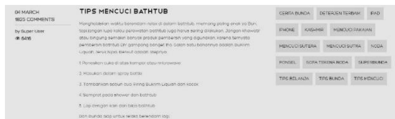
Gambar 2. 4 Laman Artikel Website PT Total Chemindo Loka

Laman artikel dalam website tersebut terdapat beberapa tulisan yang berisikan tentang tips yang ditulis oleh karyawan seperti cara mencuci bathtub , mencuci karpet, mencuci keset, dan lain-lainnya. Setiap artikel dibuat dalam jeda kurang lebih sekitar satu bulan.