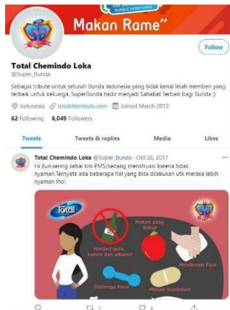
Gambar 2. 8 Laman Twitter PT Total Chemindo Loka