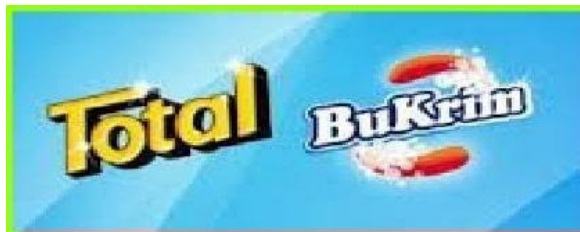
Gambar 2. 1 Logo PT Total Chemindo Loka

PT Total Chemindo Loka merupakan perusahaan yang bergerak dalam penjualan produk-produk hygiene , khususnya dalam bidang deterjen. Perusahaan ini diberi tanggung jawab untuk memproduksi dua produk deterjen baju yaitu BuKrim dan Total. Brand Total sudah berdiri sejak tahun 1985, pada saat itu, Total merupakan brand lokal pertama deterjen pencuci baju yang hadir di Indonesia. Namun seiring dengan berjalannya waktu, brand Total mengalami beberapa masalah, sehingga pada tahun 2005, brand tersebut diambil alih oleh manajemen baru dan dirubah namanya menjadi PT Total Chemindo Loka. Ditahun yang sama juga, BuKrim memutuskan untuk mengakuisisi PT Total Chemindo Loka, sehingga sampai saat ini PT tersebut memiliki dua brand dibawah naungan, yaitu Total dan BuKrim.