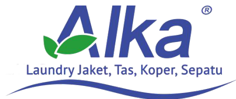
Gambar 2.3. Logo Alka Laundry

Alka Laundry adalah salah satu unit dari Velikaya Slava Retail yang menyediakan jasa laundry untuk barang-barang dari jaket, tas, koper, sepatu, hingga helm. Alka Laundry ini memiliki outlet yang berada di jalan Cinere Raya No.7. Alka Laundry memiliki spesialisasi untuk mencuci barang-barang dengan bahan yang unik, seperti kulit dan suede yang dijamin dari sisi kebersihan, keamanan bahan, dan waktu mencuci.