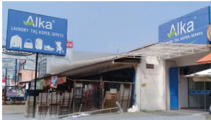
Gambar 2.4. Lokasi Alka Laundry di Cinere

Alka Laundry adalah salah satu unit dari Velikaya Slava Retail yang menyediakan jasa laundry untuk barang-barang dari jaket, tas, koper, sepatu, hingga helm. Alka Laundry ini memiliki outlet yang berada di jalan Cinere Raya No.7. Alka Laundry memiliki spesialisasi untuk mencuci barang-barang dengan bahan yang unik, seperti kulit dan suede yang dijamin dari sisi kebersihan, keamanan bahan, dan waktu mencuci.