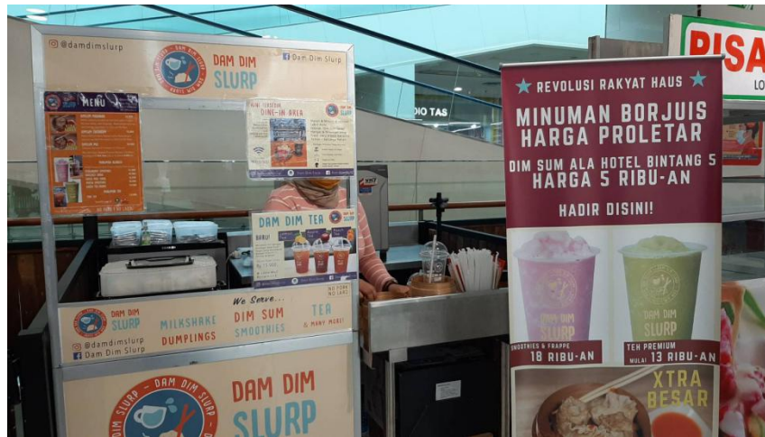
Gambar 2.6. Lokasi Dam Dim Slurp di Lotte Mall Bintaro