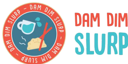
Gambar 2.5. Logo Dam Dim Slurp

Dam Dim Slurp adalah unit dari Velikaya Slava Retail yang berjalan di bidang F&B dengan spesialisasi untuk makanan dim sum dan minuman. Dam Dim Slurp ini berdiri baru saja pada awal tahun 2020. Dam Dim Slurp memiliki outlet pertamanya yang berada di Lotte Mall Bintaro lantai dua. Dim sum yang disajikan oleh Dam Dim Slurp memiliki 3 menu yaitu dim sum seafood , ayam, dan mixed . Sedangkan untuk minumannya terdapat beragam rasa dari teh apel, teh leci, milkshake strawberry , dan matcha .