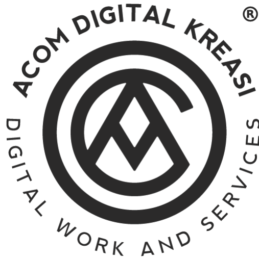
Gambar 2. 1 Logo PT Acom Digital Kreasi