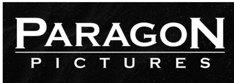
Gambar 2.1. Logo Paragon Pictures (sumber: www.paragonpictures.id )

Paragon Pictures adalah sebuah perusahaan yang didirikan pada tahun 2019. Paragon Pictures juga merupakan sebuah rumah produksi film yang fokus pada development , produksi, marketing, dan distribusi. Paragon Pictures berada di bawah Ideosource Entertainment, sebuah perusahaan funding yang telah mendanai beberapa film layar lebar seperti Keluarga Cemara, Kulari Ke Pantai, Aruna dan Lidahnya, Gundala, Bebas, Cinta Itu Buta, dan Guru-Guru Gokil. Paragon Pictures terletak di Foresta Business Loft 2 unit 36, Bumi Serpong Damai (BSD).